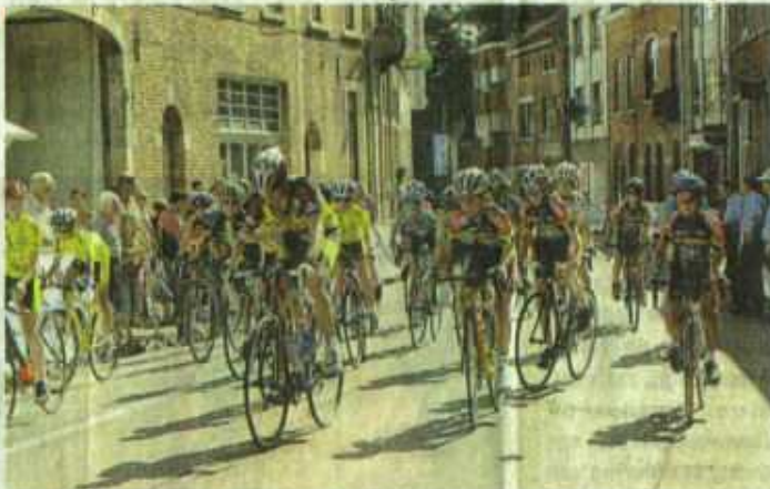
Hoegaarden was een hele zondag in de ban van wielervedstrijden.

Buiten het ongemak voor de mensen die binnen het parcours wonen, waren het vooral de bakkers in het dorpscentrum die door het evenement getroffen werden. «Vandaag mag ik gerust de omzet van de bakkerij door vier delen, want mensen zijn nu eenmaal gewoon met hun wagen tot hier te komen, ik vraag me af waarom het hele dorp van 's morgens af moet afgesloten zijn. Dat ze die koersen de zondagnamiddag organiseren. Klanten van buiten Hoegaarden die niet op de hoogte waren van het evene-